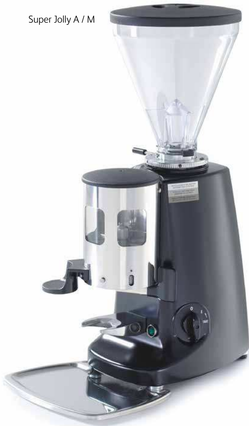
Super Jolly A / M